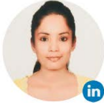
ngarica Chandel مطل أعمال أول